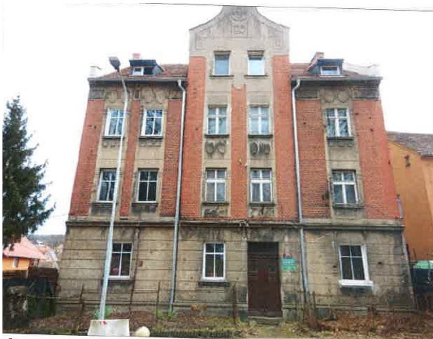
Ogólny widok budynku

na sprzedaż lokalu mieszkalnego Nr 2 znajdującego się w budynku położonym w Lubaniu przy ul. Zawidowskiej 31A wraz z udziałem we współwłasności nieruchomości gruntowej (działka nr 15/1, AM 19, Obręb II o powierzchni 148 m 2 , JG1L/00024685/9)